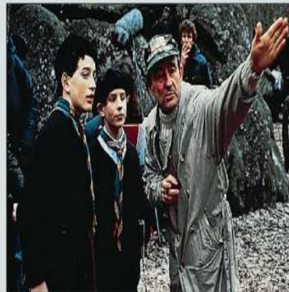
Louis Malle, réalisateur du film, avec deux des acteurs principaux

Au Revoir, les Enfants est un film réalisé par le cinéaste français contemporain Louis Malle. C'est un film autobiographique dans lequel Louis Malle évoque un épisode dramatique de sa jeunesse.